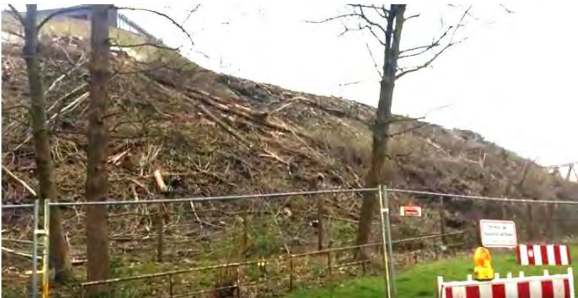
Quelle: Video vom Kahlschlag

Sowohl die Öffentlichkeit, insbesondere die aufmerksame Bürgerschaft, als auch eine wachsende Zahl der politischen Gremienvertreter/innen sahen sich massiv vor den Kopf gestoßen. 23 In der Ratssitzung vom 15.3.2016 war parteienübergreifend von Vertrauensverlust bezüglich der von der Verwaltung vorgelegten Gutachten und Informationen die Rede: "Ehrenamtliche Ratspolitiker können und müssen sich auf das verlassen (können), was ihnen vorgelegt wird." 24